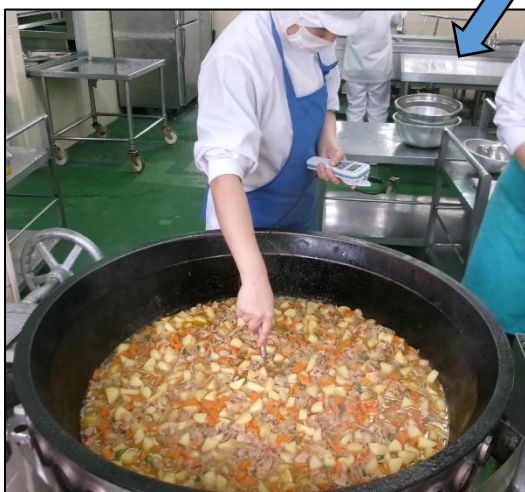
温度をはかっています