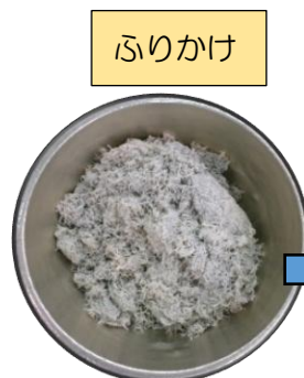
しらすを使います