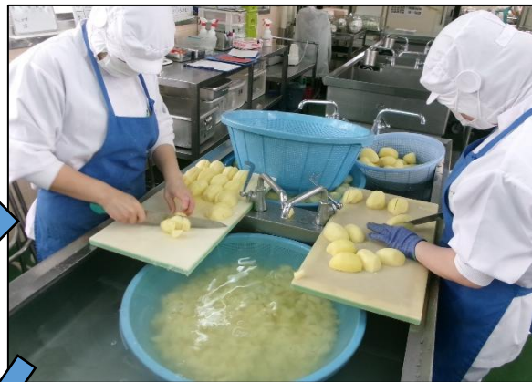
じゃがいもを少し大きめに切ります