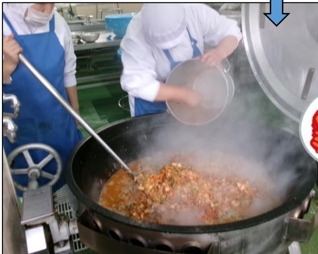
キムチを加え、炒めます