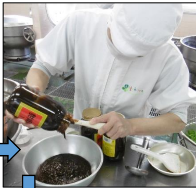
デンメンジャンを使用します