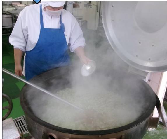
塩で味つけします